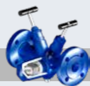
一体化疏水阀组 CONA® "All-in-One" (含截止阀, 过滤器, 止回阀, 排污阀)