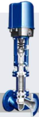
STEVI® 紧凑型 (BR423/463, 425/426, 440/441, 450/451)