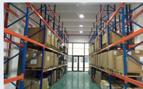
Automated System Management Warehouse 自动化系统管理仓库

ARI-Armaturen Trading (Shanghai) Co. Ltd. was established as an ARI company in June 2002. Headquartered in Shanghai, the company also has branches in Guangzhou, Tianjin, Wuhan and etc. A dense network of local sales partners guarantees rapid availability throughout the region.