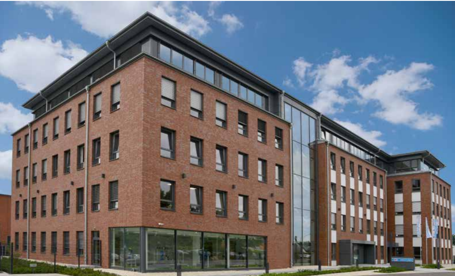
Germany Headquarter 德国总部

ARI-Armaturen is a leading international developer, manufacturer and distributor of valves as well as complementary services linked to the control, isolation, safety and steam trapping of liquid and gaseous media. From industrial processes and chemicals through shipbuilding to building management: ARI can look back on a tradition of more than 70 years as a competent partner for control - isolation - safety - steam trapping of liquid and gaseous media. We manufacture high-quality, heavy-duty valves in line with the latest standards at three different locations.