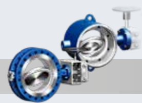
工艺系统阀 ZETRIX® 高性能双偏心金属密封蝶阀 ZEDOX®