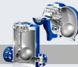
机械式凝结水回收泵 CONLIFT®, CONA® P