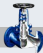
波纹管截止阀 FABA® Plus, FABA® Supra I/C