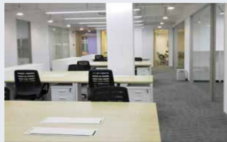
2000 2 plus Office Operations Area 超过2000 m 2 办公运营区域