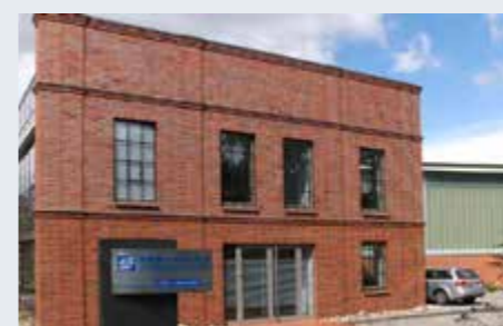
Halle an der Saale 海拉

We strive to achieve the highest possible quality. ARI manufactures advanced quality valves utilizing the latest state of the art manufacturing technology at three different locations: Schloss Holte-Stukenbrock, Homburg (Efze)-Holzhausen and Halle an der Saale. For us at ARI „Made in Germany“ is our commitment to providing you with the very best of quality manufacturing.