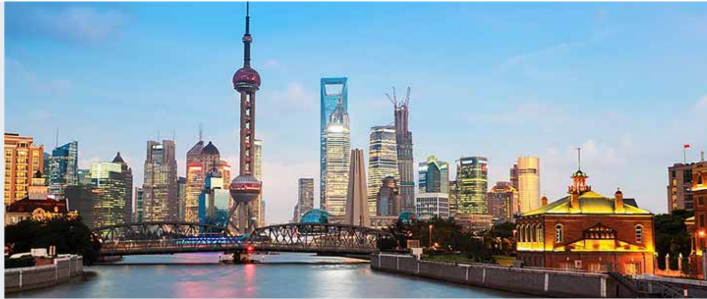
Located in Shanghai 坐标上海