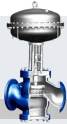
控制阀 STEVI® 坚固型 (BR 422/462, 470/471)