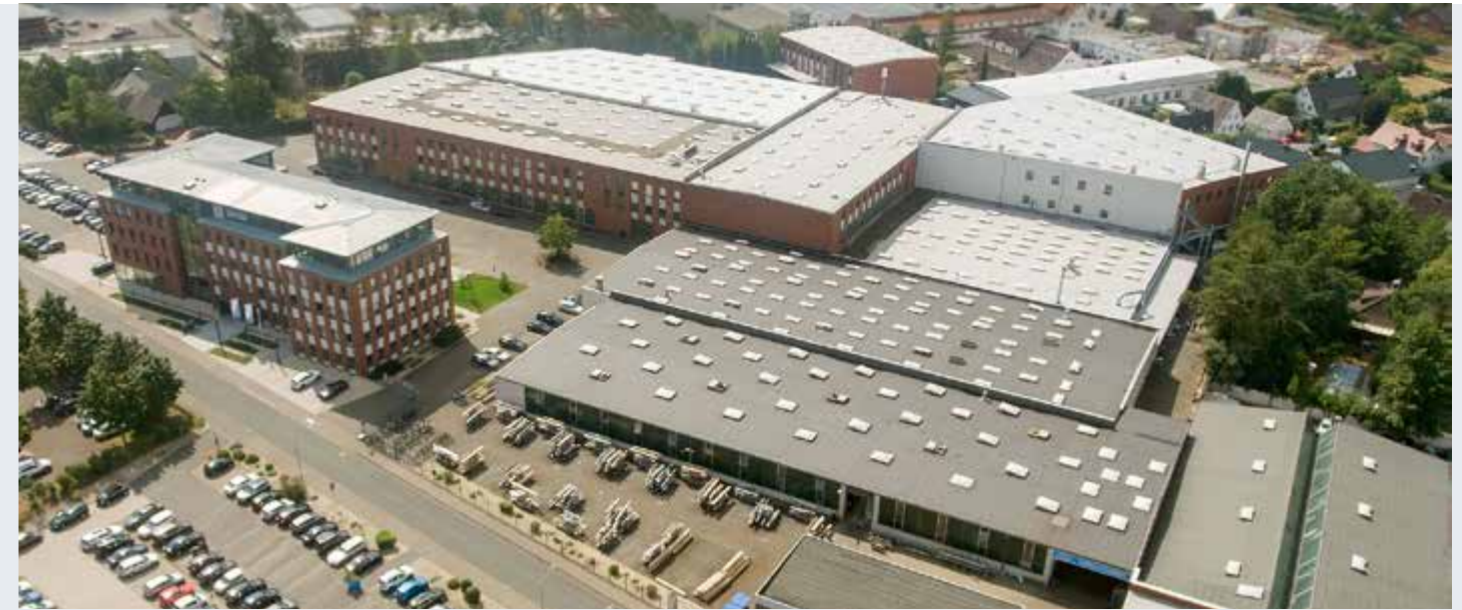
German Headquarter in Schloss Holte-Stukenbrock 斯图肯博罗科