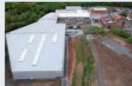
Homburg (Efze) Holzhausen 洪堡