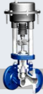
STEVI® 多样型 (BR 448/449)