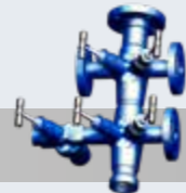
管束 CODI® 应用于收集和分配