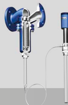
Regeln ohne Hilfsenergie TEMPTRON®