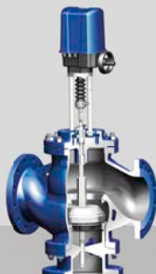
Regelventil STEVI® 423