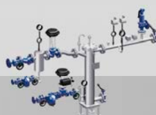
z.B. Wärmetauscher ENCOsys®