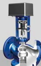
Heizungs-Regelventil STEVI® H