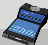
Präzise Messtechnologie ARImetec DX