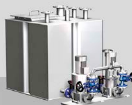
z.B. Kondensatrückspeise- anlage CORsys®