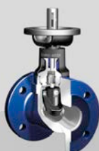
Weichdichtendes Absperrventil EURO-WEDI®