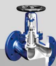
Faltenbalg-Ventil FABFA® Plus