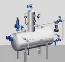
z.B. Speisewasserbehälter mit Entgaserdom

Profitieren auch Sie von Vielfalt made by ARI. Fordern Sie weitere Informationen!