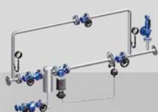
z.B. Druckreduzierstation PREsys®