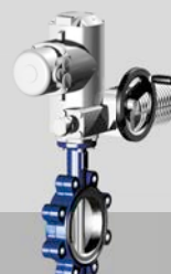
Absperrklappe ZIVA® G