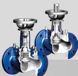
Strangregulier-Ventil (statisch) ASTRA®